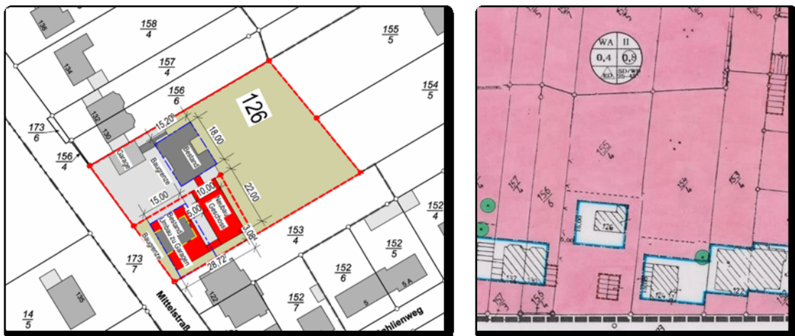
Abbildung 2: Projektskizze und Auszug aus dem Bebauungsplan

An die Verwaltung wurde nachstehend erläutertes Vorhaben mit der Bitte um Vorabstimmung gerichtet. Ziel der Planungen ist es, auf dem bisher bebauten Grundstück den Bestand abzureißen und in zweiter Reihe einen Neubau zu errichten. Der Bebauungsplan lässt derzeit die Bebauung nur straßenseitig im Bereich des Bestandsgebäudes (Mittelstraße 124) zu.